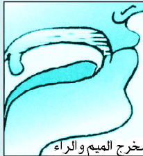
مخرج الميم والراء

﴿رَبَّنَا أَفْرِغْ عَلَيْنَا صَبْرًا﴾ (٢) .