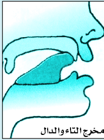
مخرج التاء والذال

ومن طرف اللسان وأصول الثنايا العليا، ومنه تخرج الطاء والذال والتاء، وتسمى هذه الحروف بالانطعية، لخروجها من نطع غار الحنك الأعلى، وهو مقدم الحنك (المغارز)، نحو: