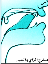
مخرج الزاي والسين

ومن طرف اللسان مع ما بين الثنايا العليا والسفلى قريبة إلى السفلى مع انفراج قليل بينهما، ومنه تخرج الزاي والسين والصاد، نحو: